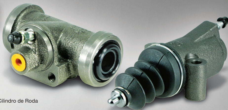
Cilindro de Roda